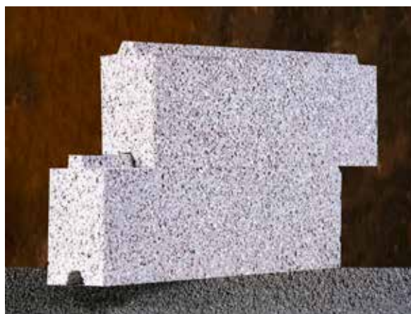
Pannelli disponibili con incastro maschio femmina su richiesta