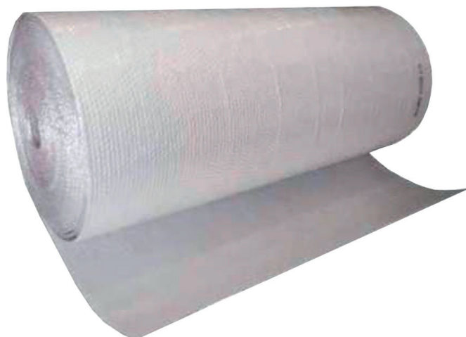
Lamina di polietilene ad alta densità e resistenza